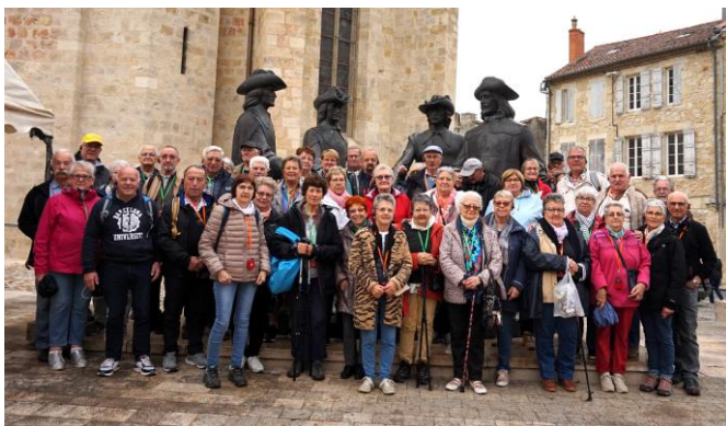
A Condom ! Un pour tous...

Il n'est pas possible de résumer en quelques lignes ce magnifique voyage de 10 jours ! Placé sous le signe de la gastronomie locale et du patrimoine Gascon, 49 adhérents ont pu profiter de cette très belle région !