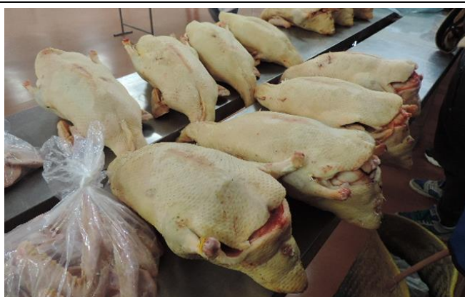
Le « marché au gras »