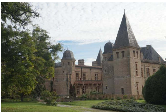
Le château de Caumont – Le comte de Castelbajac